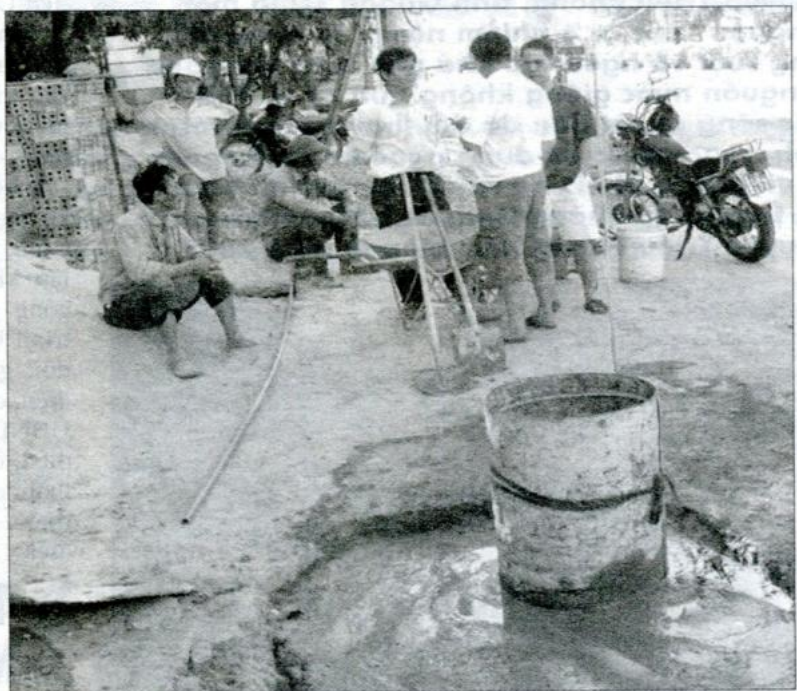
● Người dân bất bình, ngăn cản việc tự ý dời cột điện của cán bộ “nhà đèn”.

Theo quy định, để di dời cột điện thuộc những tuyến quan trọng như trong trường hợp này thì cần phải được nghiên cứu, xem xét và được sự chấp thuận bằng văn bản của Cty Điện lực Hà Tĩnh; phương án được duyệt của điện lực thành phố; giấy phép của Khu quản lý đường bộ IV (đơn vị quản lý hành lang giao