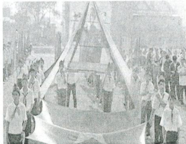
Hội khỏe Phù Đổng ngành giáo dục.

Ngay từ đầu năm học tiếp thu, quán triệt chủ trương của Sở GD và ĐT. Phòng giáo dục đào tạo huyện Hương Sơn đã xác định nhiệm vụ trọng tâm của năm học 2010-2011 là tiếp tục đổi mới công tác quản lý, thực hiện các cuộc vận động, xây dựng phong trào trường học thân thiện, học sinh tích cực. Nhìn lại các hoạt động trong học kỳ I vừa qua, bước đầu ngành đã đạt được một số kết quả đáng phần khởi. Ngành tiếp tục chỉ đạo bồi dưỡng đội ngũ, tăng cường cải tiến phương pháp dạy học ở tất cả các bậc học, cấp học. Khuyến khích giáo viên áp dụng công nghệ thông tin trong dạy học để các tiết dạy kích thích được hứng thú học tập của học sinh, kết hợp lời giảng với hình ảnh trực quan, minh họa sinh động, nâng cao hiệu quả tiết dạy. Triển khai việc áp dụng " Bản đồ năng lực tư duy " trong việc dạy và học ở các trường THCS. Xây dựng các phòng máy, phòng nghe nhìn để dạy Tin học, Tiếng Anh cho học sinh từ lớp 3 đến lớp 9. Đến nay đã có 14 trường tiểu học, 19 trường THCS có phòng máy. Tăng cường chỉ đạo công tác sinh hoạt chuyên môn tổ, khối. Nội dung sinh hoạt tránh bệnh hình thức, nặng về hành chính mà đi sâu vào các nội dung chuyên môn, nghiên cứu, trao đổi