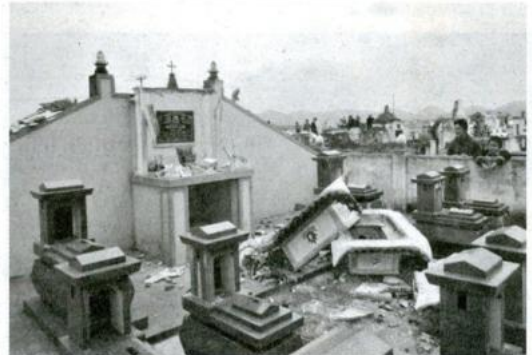
Hiện trường những ngôi mộ bị đập phá